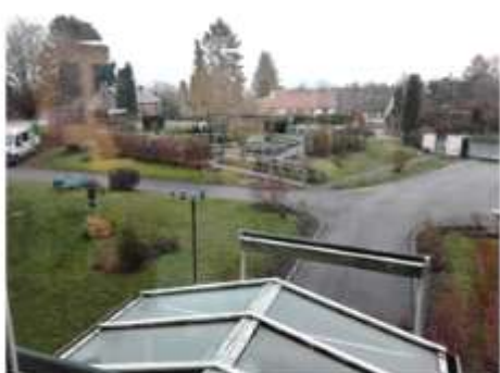
2 janvier 10h14

Le mois de janvier a débuté avec les premiers flocons de neige. Voici quelques photos prises à un quart d'heure d'intervalle