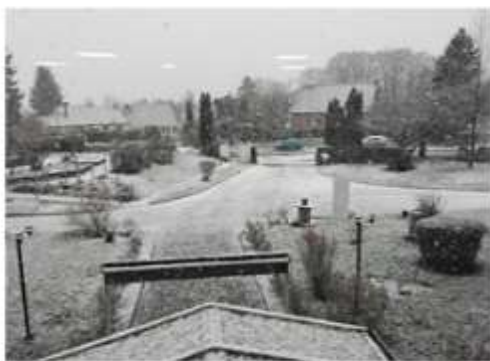
2 janvier 10h32