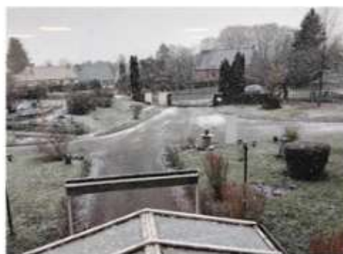
2 janvier 10h32